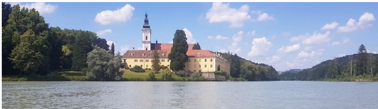
Das Kloster Vornbach bei Neuhaus am Inn.

Wetter/Wasserstand/Alternativen: Wir sind gut ausgerüstet und paddeln bei fast jedem Wetter. Ausnahmen sind aus Sicherheitsgründen Gewitter, Starkregen, starker Nebel, Hochwasser, Hagel oder Sturm. Salzach und Inn sind auf dieser Strecke bei durchschnittlichen Verhältnissen keine schwierigen Flüsse. Bei zu hohem Wasserstand sind eventuell Verkürzungen notwendig. Bei gefährlichem Hochwasser fahren wir gar nicht. Sicherheit geht immer vor.